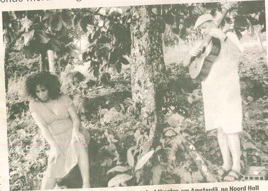
DIA 15 Dupla se apresenta no Voldelpark Openluchtheater, em Amsterdã, no Noord Holl